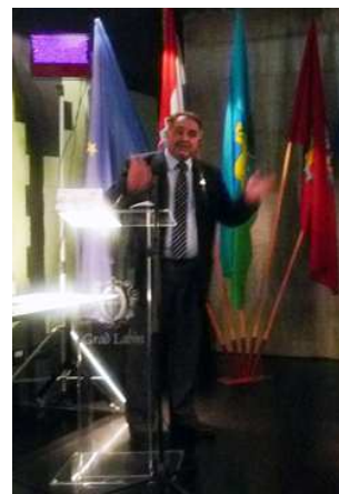
Prezentacija u Labinu

Tokom 2014. godine u Centru je boravilo šestoro gostiju, izuzetno renomiranih umetnika. Posebno treba istaći da su gosti aktivno učestvovali u kulturnom životu Beograda i Novog Sada. Književnica iz SAD aktivno se uključila i u promovisanje donatorstva za stradale u poplavama.